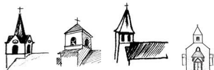
Ochiaz Villes Vouvray Craz