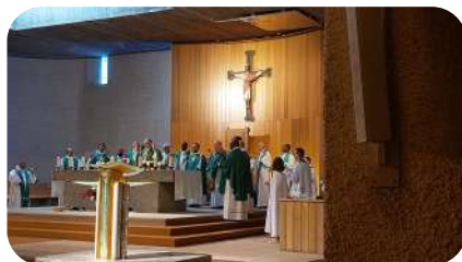
Photos de la rentrée diocésaine 2024